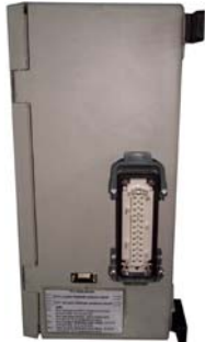
Kumanda Panosu Yandan Görünüş