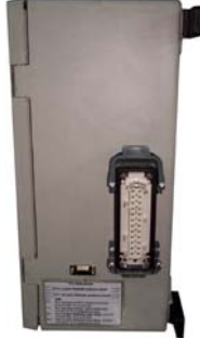
Kumanda Panosu Yandan Görünüş