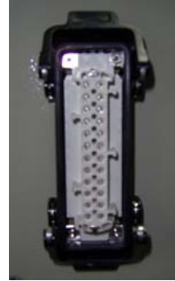
Redresör Üzerinde Bulunan Soket